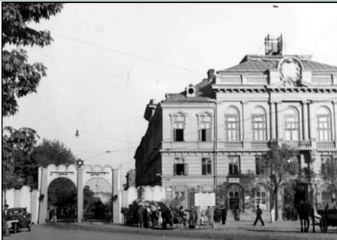
משמאל: שער כניסה לגטו

הקונצרטים הרשמיים היו חייבים לקבל את אישורו של הגסטפו, ומותר היה להשמיע בהם רק יצירות של