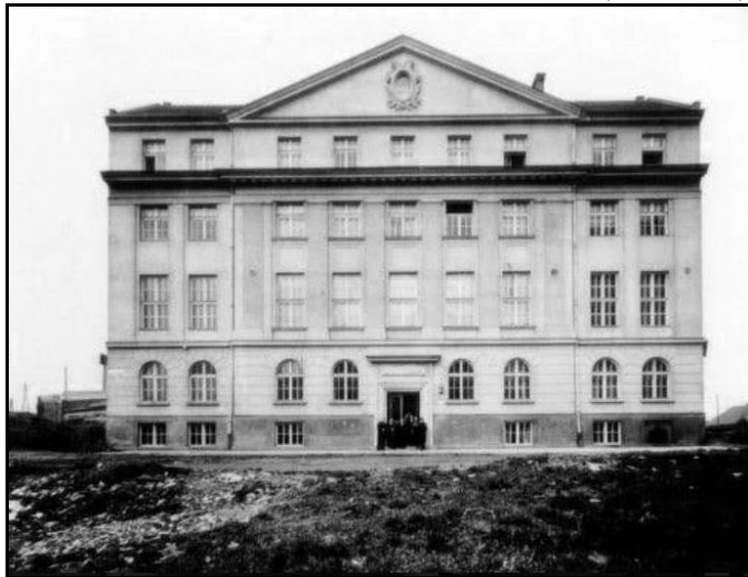
מעון הסטודנטים של אגודת אוגניסקו בפשמיסקה 3

פעילותו העיקרית של "השחר" היתה בשטח החינוך הציוני: התרמות עבור קק"ל וקרן היסוד, הסברה והחיאת השפה העברית. כמו כן ערך "השחר" תעמולה ציונית נרחבת בין הסטודנטים היהודים כדי למשוך אותם לשורותיו, תוך שהוא נאבק נגד זרם ההתבוללות. במישור הסוציאליסטי יצא "השחר" להגן על זכויותיהם של הסטודנטים היהודים.