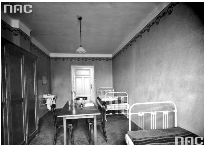
חדר במעון סטודנטים של אוגניסקו

הסטודנטים היהודים שלמדו באוניברסיטה היגלונית לא גילו זיקה לעסקנות ציבורית, בעיקר בשל ההתבוללות היהודית החזקה, הפחד מגילויי אנטישמיות וכן אדישותה של האינטליגנציה היהודית לבעיות הפוליטיות. יחד עם זאת מספר סטודנטים כתבו ופרסמו מאמרים בנושאים פוליטיים. אלה היו