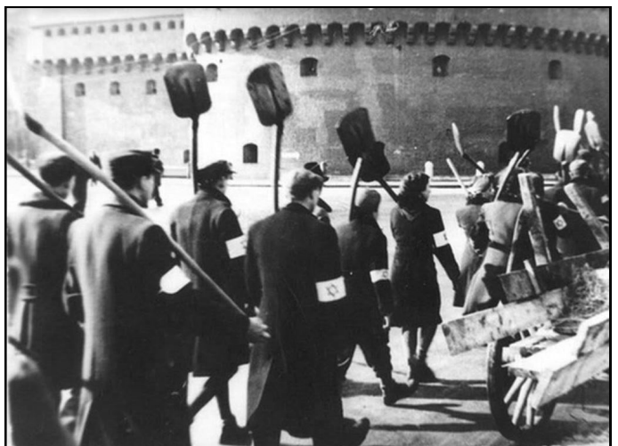
"עובדים חיוניים" יהודים בדרכם לעבודה

"...יחסם של השלטונות הגרמניים אל ה'יודנראט' היה גרוע בהרבה מיחסם אל המשטרה היהודית. מן ה'יודנראט' לא קיבלו טובות, הנאה ותועלת, וזה היה עבורם העיקר. כך, גם לא ניתן לדבר על אמון שרחשו הגרמנים ל'יודנראט', אף כי במידה מסויימת הוא היה קיים כלפי המשטרה היהודית כיחידה, שאחדים מבין אלה ששירתו בשורותיה היו מסורים בצורה עיוורת לגרמנים.