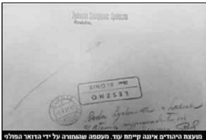
מועצת היהודים איננה קיימת עוד. מעטפה שהוחזרה על ידי הדואר הפולני

בהתרגשות רבה הוא מסר אלבום בכריכה דהויה ואמר: "כעת זהו הזמן למסור פריט היסטורי זה ל ידיכם. חשוב שהעולם יכיר את הסיפור ויזכור, ויידע גם כי הפולנים היו שותפים למעשי האכזריות של הגרמנים