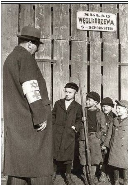
עובד ועדת הבריאות בודק את הילדים

המחלקות היו המוציאות לפועל של החלטות הוועדות. לחלק מן